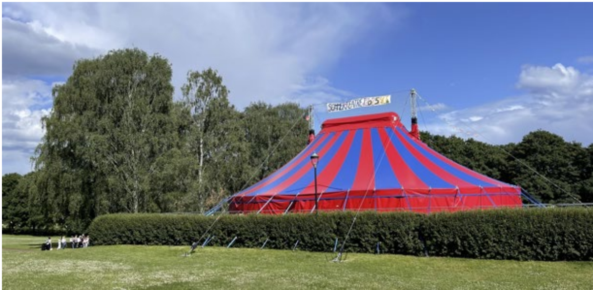
Sparebankstiftelsen DnB har i 2025 støttet Teaterhøgskolen med midler til nytt forestillingstelt og scenemoduler. Det betyr at studentene kan fortsette med Sommerteatret for barn. Etter hvert vil det også bli workshops for barn og unge i Oslo, et samarbeid mellom Kunsthøgskolens scenekunstavdelinger innenfor dans, teater og opera.